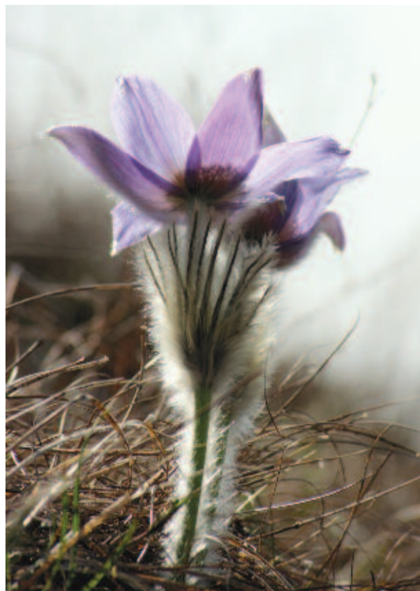
„A dombraszállt Nap gyújtó fényözönben fürdette a parányi templomot” – áprilisi leánykőkörcsin

Néha gyorsan odajön egy madár, de olykor hosszú évek is elmúlnak, míg elhatározza magát, hogy leszáll. Ne veszítsük el a türelmünk, várjunk, merengjünk. Várjunk, ha kell, éveken át, száz év nem a világ, hogy gyorsan vagy lassan jön-e meg a madár, nincs semmi összefüggésben vele, hogy lesz-e a képnek majd sikere. Amikor megjön a madár, – ha megjön a madár – mélységes csendben legyünk, várjuk meg, amíg a kalitkába belép, s bent van, ha már besétált egyszer, zárjuk be ajtaját gyorsan az ecsettel. Aztán tüntessünk el minden rácsot vizsgálva, nehogy egy csöpp is hulljon a madárra. Fessünk aztán egy tündéri szép fát, s a legszebb ágat válasszuk a madárnak. Fessük meg a zöld lombokat, a borzoló szelet, a napban táncoló porszemeket, a fű bogarainak zsváját a nyári melegben, s várjuk meg, amíg a madár dalolni kezd önfeledten.