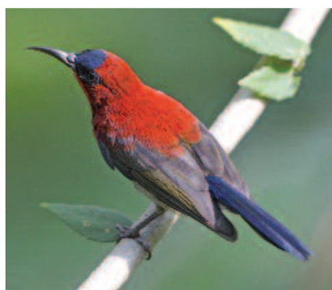
Skarlát nektármadár (Aethopyga siparaja)

ben tűnik ki. Hazája Thaiföldtől Szumátráig és Jávaig terjed. A 15 centis madár nagy levelek alá építi fészket, gyakran azonban lelógó gyökerek vagy fán termő (epifita) páfrányok közé. Fészekanyaga száraz moha, finom gyökerek, rostok és levelek bordázata. Ezeket pókhálóval erősíti az alapzatához. A csőre a fejénél hosszabb, erős, és így a kevésbé hajlékony virágokba is be tud nyúlni.