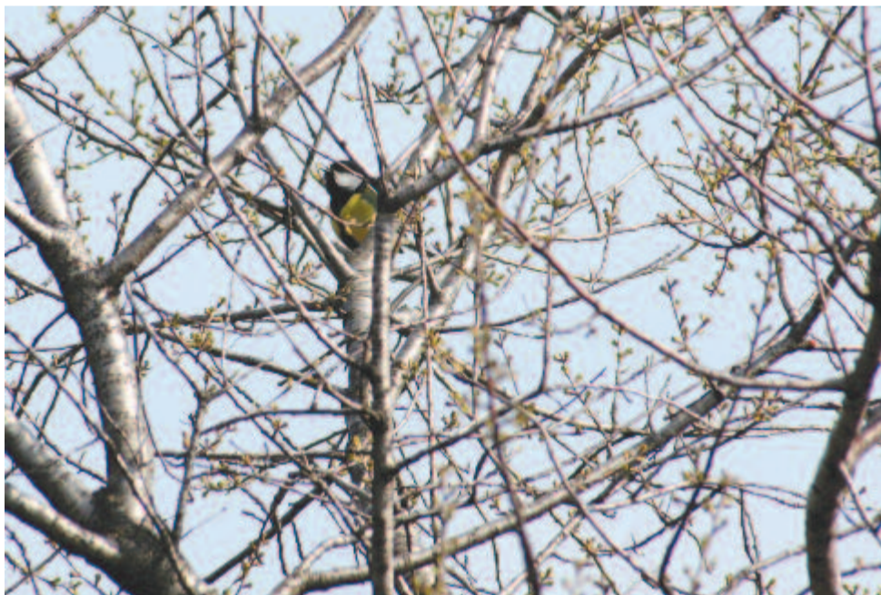
„Aztán tüntessünk el minden rácsot (...), amíg a madár dalolni kezd önfeledten”

Virágvasárnap. 1943. Jékely Zoltán versében, ami a háború kellős közepén íródott, nem győzedelmes bevonulásról szól, hanem a háborúbéli hátország méltánytalan nyomoráról. Egyetlen méltóság-pillanata a versnek a templom képe.