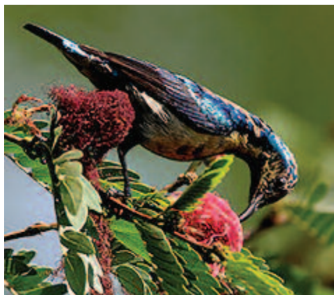
Bíbor nektármadár (Cinnyris asiaticus)

Délkelet-Ázsiában mindenütt elterjedt faj; a színe ibolyakék, a tollai fényesek. Sötét